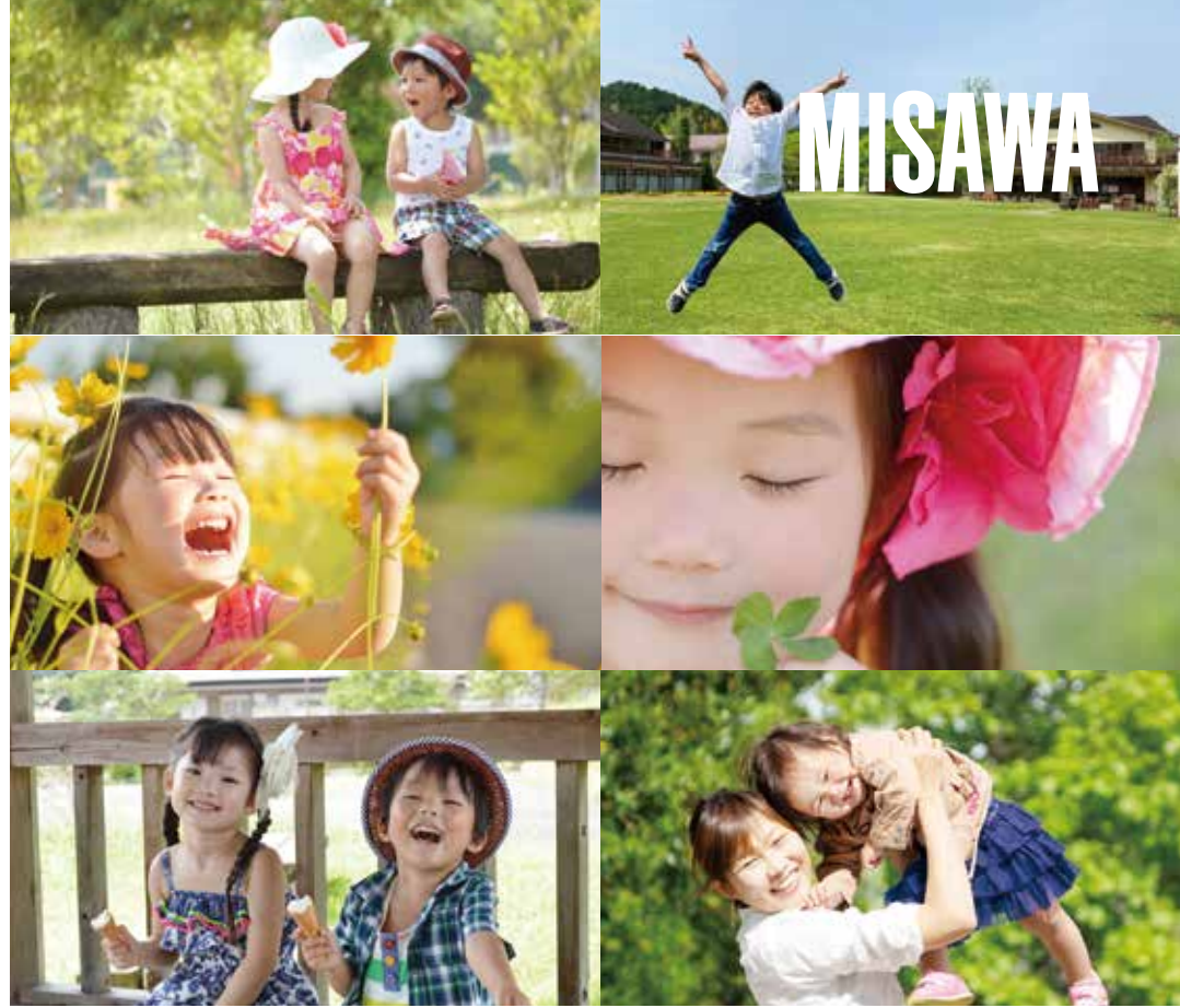
※掲載写真はすべてイメージです。